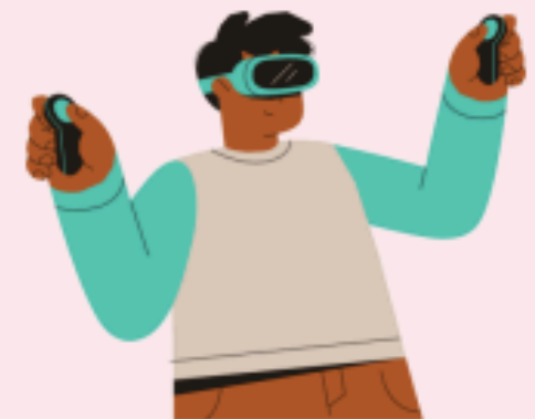
منصة الواقع الافتراضي الطبية للجيل القادم